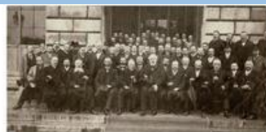
Alexandre Ribot et les anciens élèves du lycée de Saint-Omer (devant l'hôtel de ville, vers 1910)