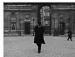
Alexandre Ribot dans la cour de l'Élysée (1921)